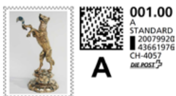
E. E. Zunft zu Webern