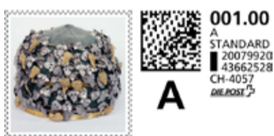
E. E. Zunft zu Rebleuten