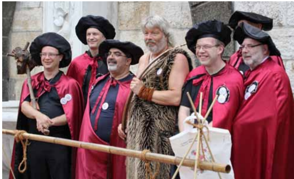
Wenn der Urmensch, der «Mammutier» in seinem struppigen Fellanzug in sein Horn bläst, bedeutet dies, dass der Bannumgang durchs Gundeldingerquartier und das Bruderholz seinen Anfang nimmt.

Mit dem «Club zur Alten Klappe», dem «Wurzengrabenkämmerli» und den «Tragbrüdern» haben wir in unregelmässiger Folge Gesellschaften vorgestellt, die schon über ein gewisses Alter verfügen, aber nur am Rande mit dem baselstädtischen Zunfswesen in Verbindung stehen. Heute nun präsentieren wir eine noch junge Gesellschaft, die aber auch schon über eine gewisse «Tradition» verfügt.