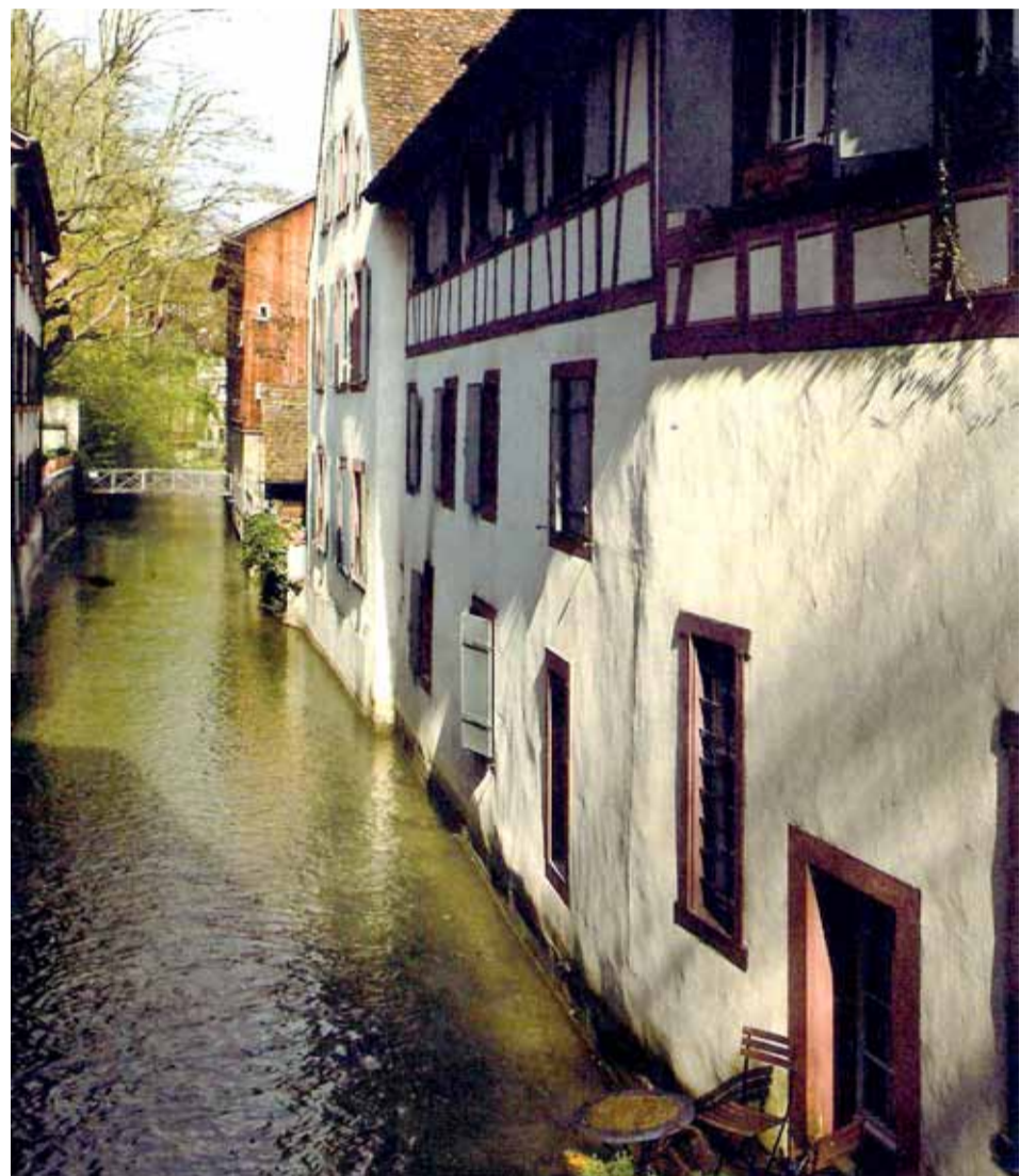
Im Mittelalter befanden sich am St. Alban-Teich im so genannten Dalbeloch eine Vielzahl von Mühlen, so kennt man aus alten Dokumenten die Rheinmühle, die Almosenmühle, die Leimersmühle und auch die Spiesslimühle. Die Mühleräder – mit Ausnahme am Auslauf beim Papiermuseum – sind indes verschwunden.

Der «St. Alban-Teich» ist ein eigentlicher Gewerbekanal. In früheren Zeiten hatten sich an seinem Verlauf über ein Dutzend Wassermühlen angesiedelt, die Gewerbe und Industrie als «Maschinenantrieb» dienten. Vor