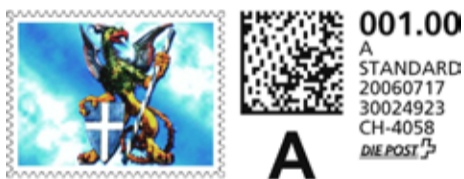
E. E. Zunft zu Schiffleuten