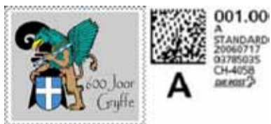
E. E. Gesellschaft zum Greifen